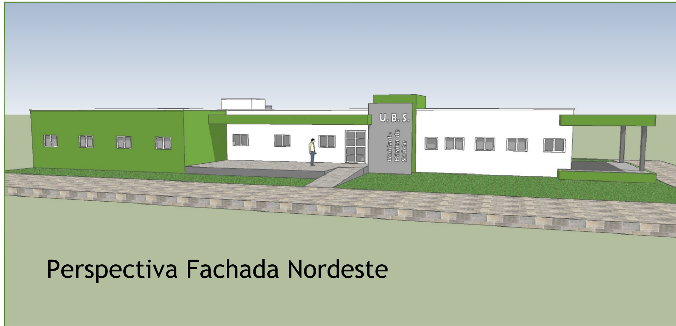
Perspectiva Fachada Nordeste