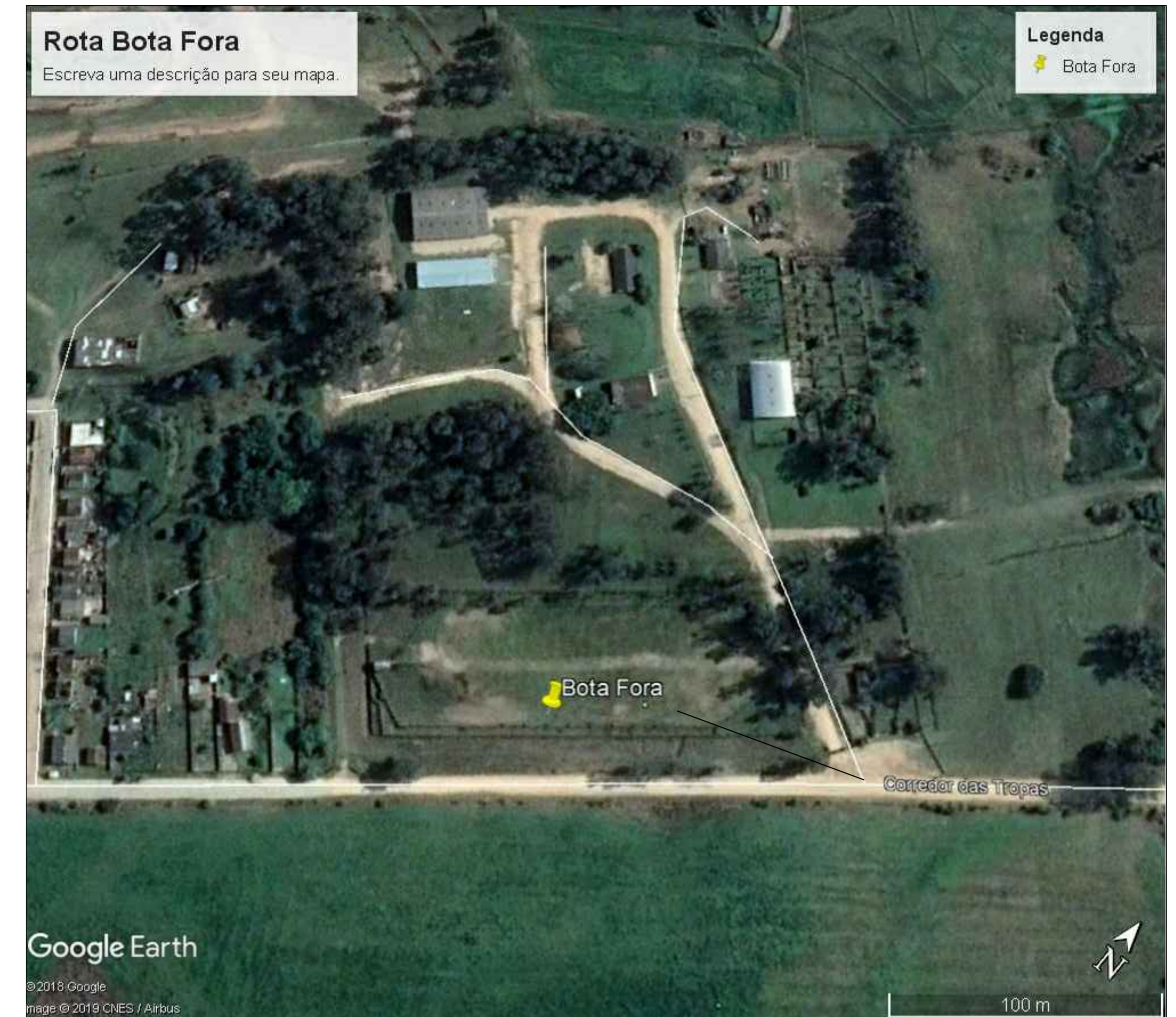
ROTA BOTA FORA ATÉ A OBRA - 0.030KM