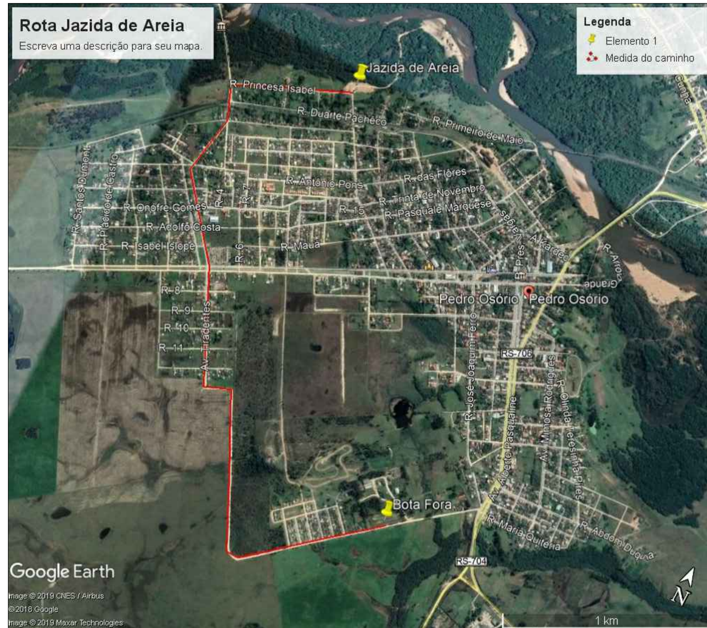
ROTA JAZIDA DE AREIA ATÉ A OBRA - 3.771 KM